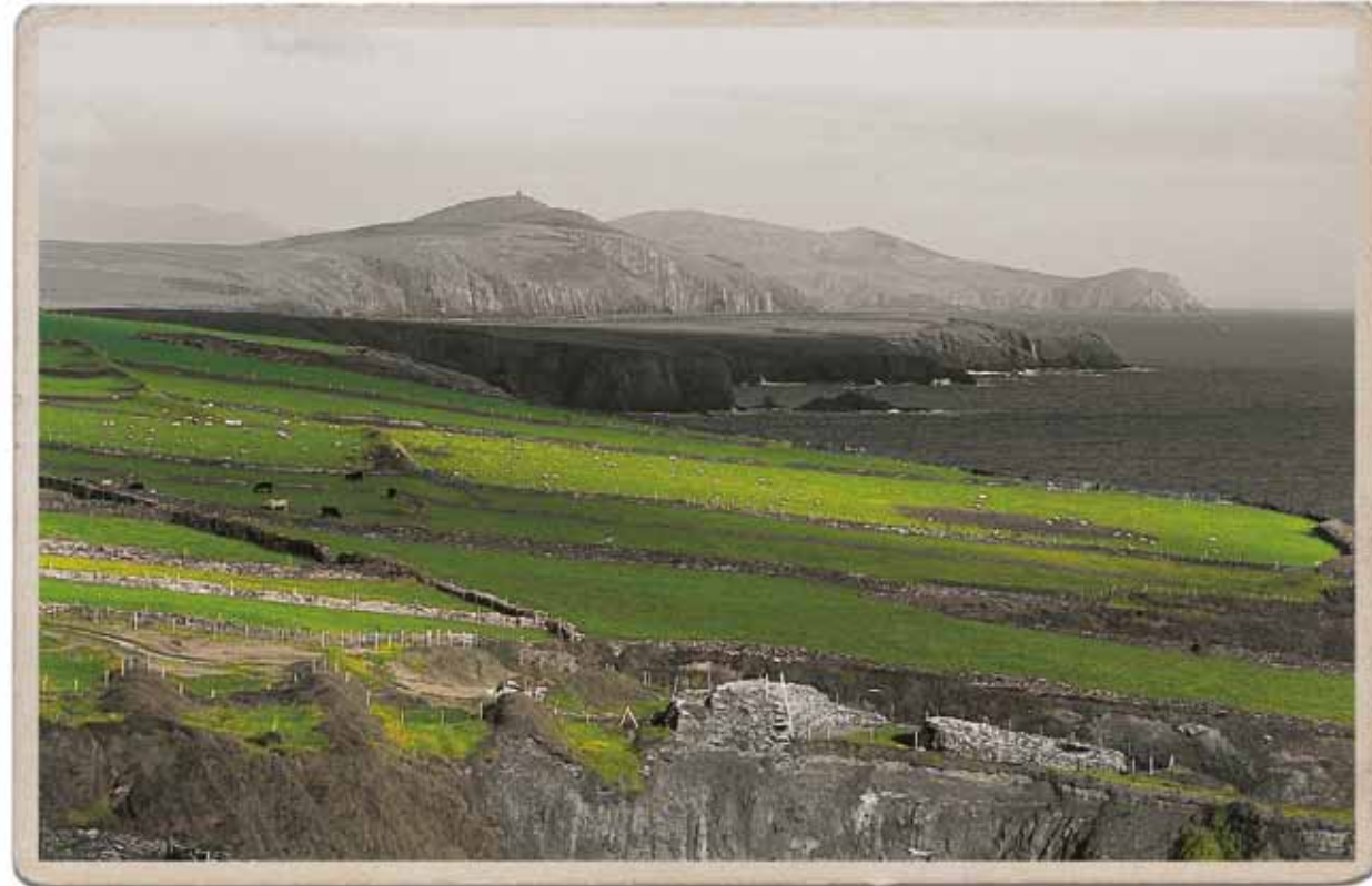
SMARAGDINSEL DINGLE PENINSULA